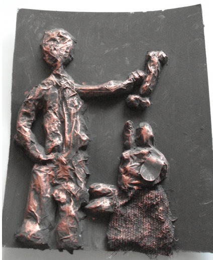
Avtorice: Kaja Skol

Z učenci umetniškega krožka smo izdelali reliefe iz papirja (kaširanje). Izdelke smo poslali na likovni natečaj OD RELIEFA IN PLASTIKE DO MATERIALNE SLIKE v Šoštanj. Nekaj izdelkov si lahko ogledate.