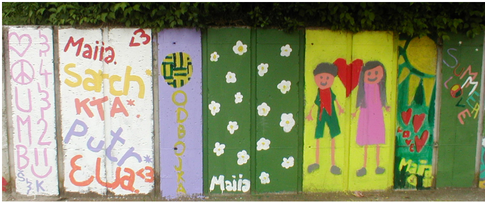
Steno na šolskem igrišču so prebarvale učenke sedmih in osmih razredov.

Tudi v letošnjem šolskem letu so se učenci trudili pri pouku, sodelovali pa so tudi na raznih tekmovanjih, kjer so dosegli mnogo priznanj. Iskrene čestitke učencem in njihovim mentorjem.