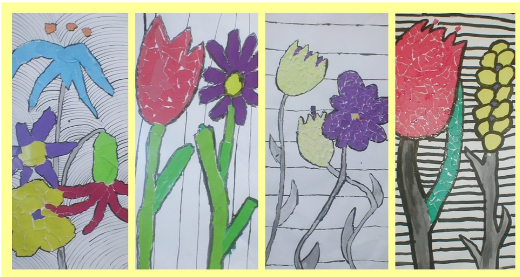
Rožice so ustvarili učenci sedmega razreda.