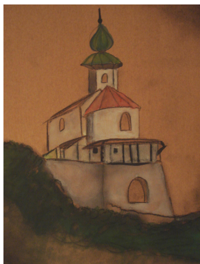
Avtorica: Kaja Skol