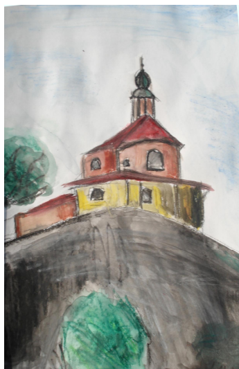
Avtorica: Nina Zakrajšek