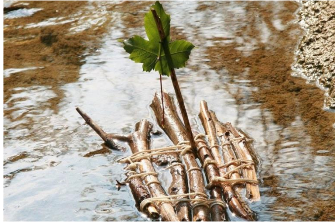
Slika 2: Primer izdelanih spominkov