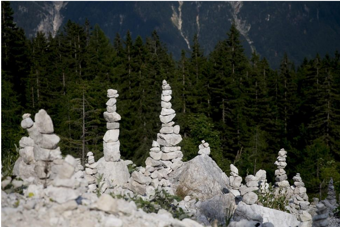
Slika 3: Kamniti možici