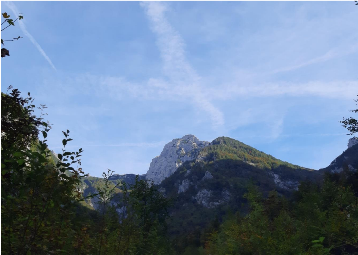
Slika 5: Prva fototočka

V mislih imamo dve zelo zanimivi fototočki, kjer bi se lahko obiskovalci fotografirali. Na njiju bo obiskovalce opozoril vodič. Seveda, se fotografirajo lahko tudi drugje, če želijo.