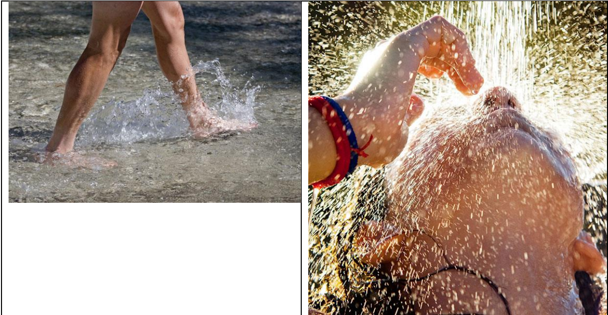
Slika 4: Knajpanje s polivanjem in oblivanjem

Ker kopanje v vodnih izviroh ni dovoljeno, se bo knajpanje izvajalo s polivanjem nog in rok. Prepoved nas na srečo nič ne ovira, saj knajpanje deluje že, če se samo polijemo z vodo in ne obrišemo, saj s tem spodbudimo krvni obtok in prekrvavitev dela telesa.