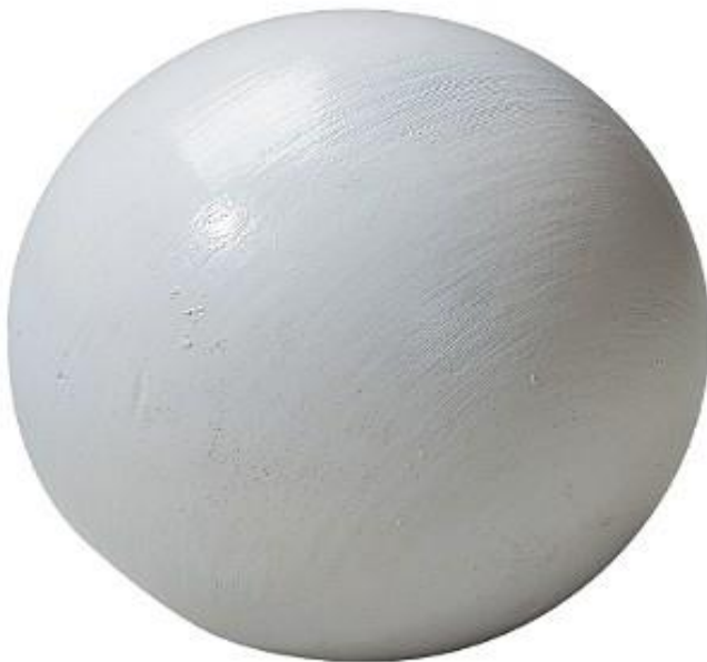
Slika 1: Biser