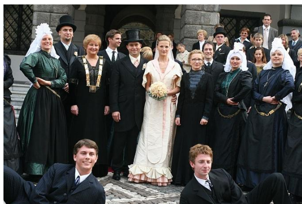
Slika 5: Meščanska poroka