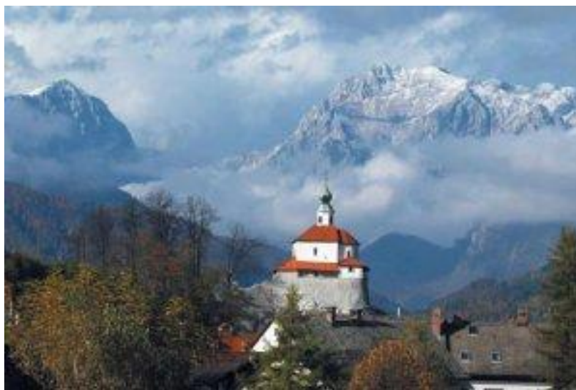
Slika 1 Pogled na kamniški Mali grad in kamniške planine

Avtorji turistične naloge, Veselo v Kamnik, se za sodelovanje lepo zahvaljujemo vsem učencem, še posebno pa učiteljici Špeli Podlipnik za dramatizacijo meščanske poroke in učiteljici Ireni Zagožen za izdelane makete živil in kulise za fotografiranje ženina in neveste.