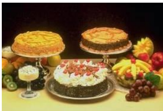
Slika 6: Sladice

Za sladico so gostje dobili torte iz listnatega testa, biskvitne torte, torte iz črnega kruha, linško torto, šarkelj (pecivo iz kvašenega testa z rozinami), različno malo pecivo in polnjeno pecivo.