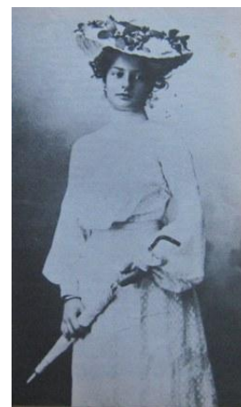
Slika 4: Meščanka