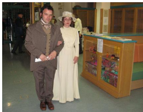
Slika 3: Meščanski par

Ženske obleke so bile sestavljene iz več slojev. Pod obleko so nosile spodnjice, ki so segale čez kolena na koncu pa so bile okrašene s čipkami. Sledi srajca, ki so jo nosile pod steznikom zaradi katerega so bile videti vitkejše. Pod obleko so nosile tudi več slojev tankih kril. Število slojev je bilo odvisno od letnega časa in vremena. Čez to so dale železen obroč, ki je dal spodnjemu delu obleke okrogel videz. Čez vse to so na koncu oblekle obleko, ki je bila okrašena z elegantnimi vzorci. Za zunaj so imele senčnike, saj so morale biti blede. Moški so nosili dolge hlače in srajco s čipkastim ovratnikom, čez to pa suknjič in na glavi klobuk ali cilinder.