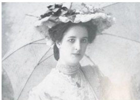
Slika 10: Marija Vera

Marija Vera , slovenska gledališka igralka in režiserka se je rodila 22. novembra 1881 v Kamniku in umrla 12. januarja 1954 v Ljubljani.