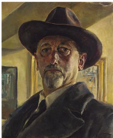
Slika 8: Ivan Vavpotič

Ivan Vavpotič , slovenski slikar, ilustrator in scenograf, se je rodil 21. februarja 1877 v Kamniku in umrl 11. januarja 1943 v Ljubljani. Je predstavnik akademskega realizma, portretist in vedutist. Pomembno je še njegovo ilustratorsko delo in osnutki za gledališke scene. Študiral je v Pragi, Parizu in na Dunaju. Kot profesor je poučeval na realki v Idriji. Po opuščenju profesuri je živel kot svoboden umetnik v Ljubljani. Bil je med organizatorji stanovskega društva in kritik. Vavpotič je avtor prvih slovenskih poštarnih znamk ( Verigar ), uporabljenih tudi v Kraljevini SHS.