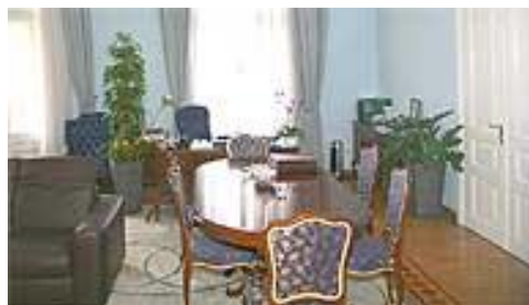
Slika 2: Pogled v meščansko stanovanje